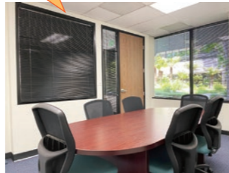
窓から外の緑も見える素敵な会議室