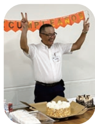
お誕生日のお祝いをしました