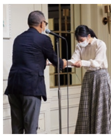
内定証書を交付しました