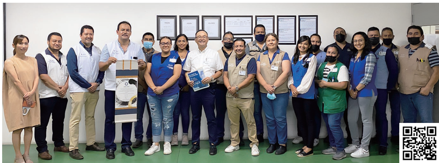
Aoi Industries Mexicoを表彰