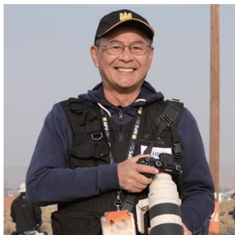
RENOでカレンダー撮影