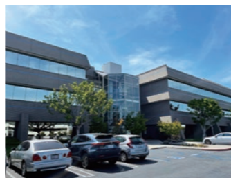
約50社が入っている大きなビルディング