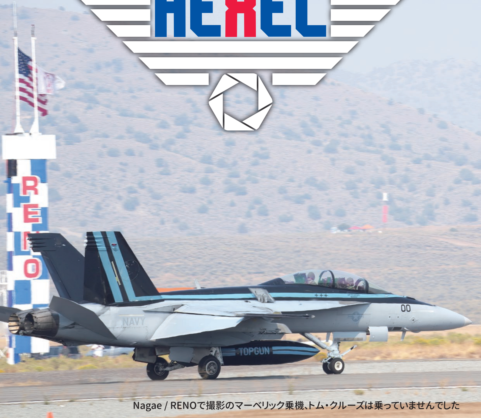
Nagae / RENOで撮影のマーベリック乗機、トム・クルーズは乗っていませんでした