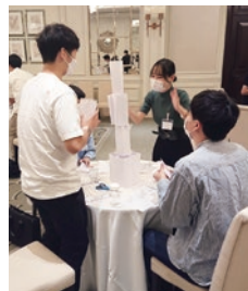
グループワークで緊張をほぐしました