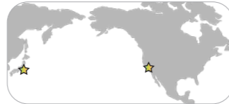
トランスと日本の時差は、16時間! 距離(測地線長)は、約9,000km!