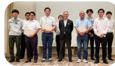
受賞された皆さんです